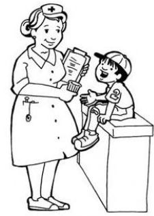
L'infirmière scolaire :