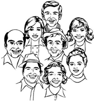
Ma famille :

Qui contrôle que tu grandis bien, que tu es en bonne santé ?