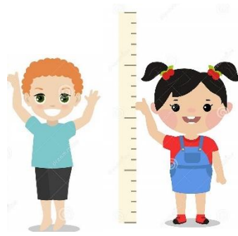
Mon prénom :